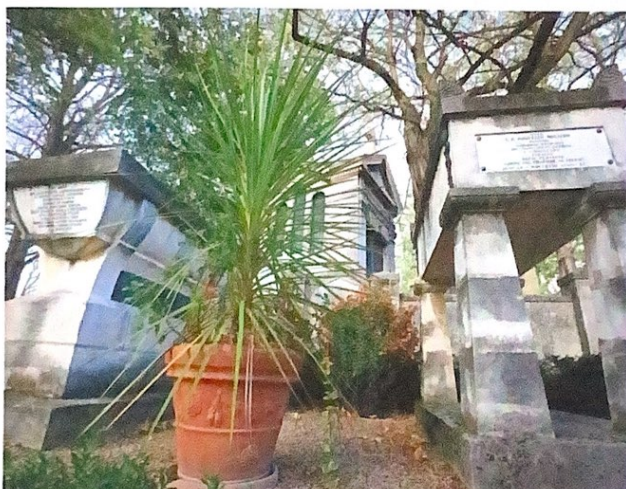
▶ Les cenotaphes de Molière et de Jean de La Fontaine.