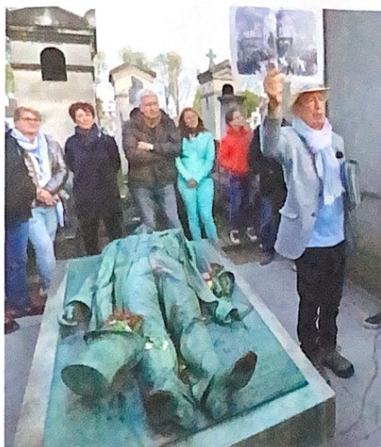
▲ De gauche à droite : la tombe de Tignous et le gisant de Victor Noir.