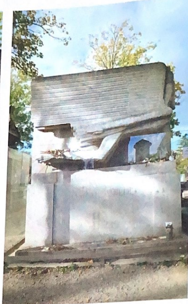
◀ Le tombeau d'Oscar Wilde.