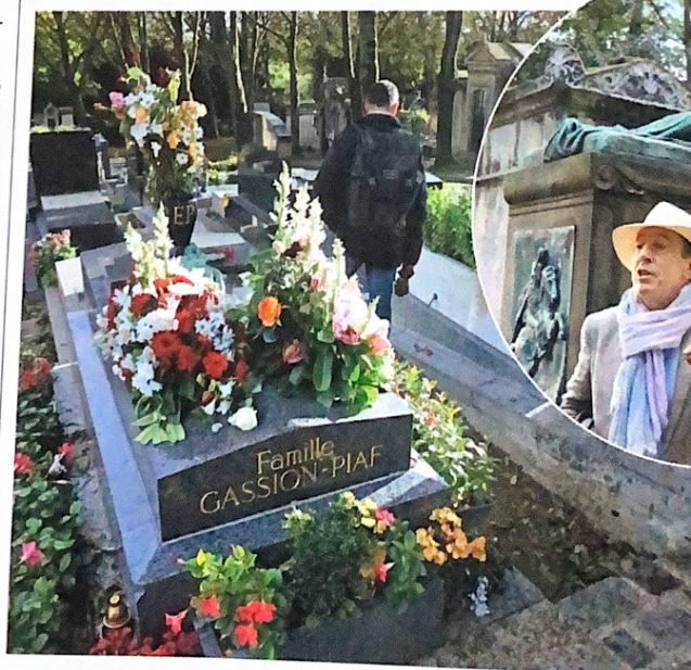
◀ La tombe d'Édith Piaf.