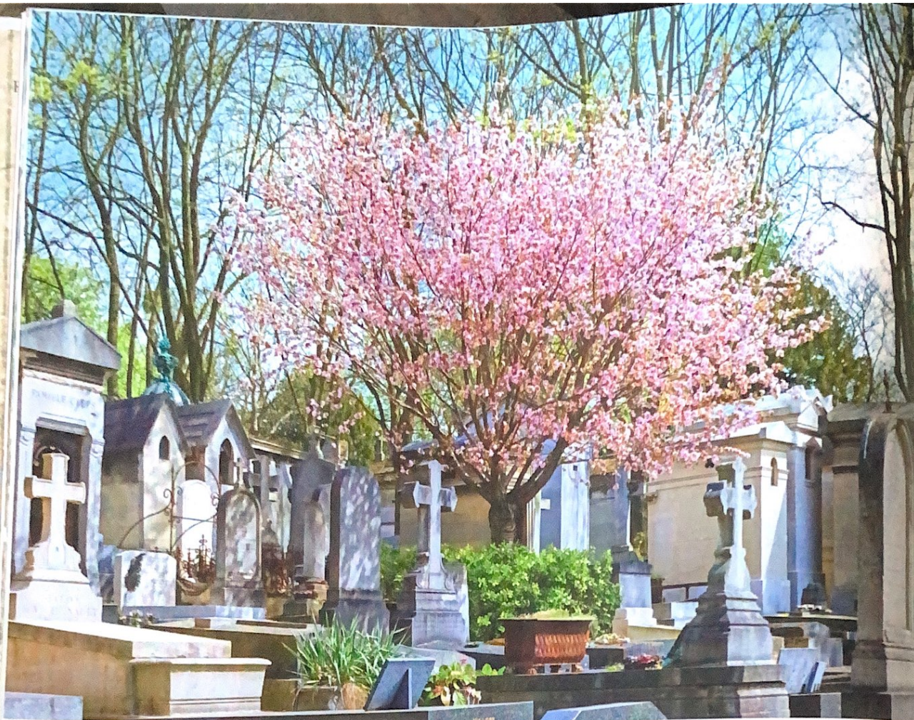
Le monument funéraire de Félix de Beaujour.